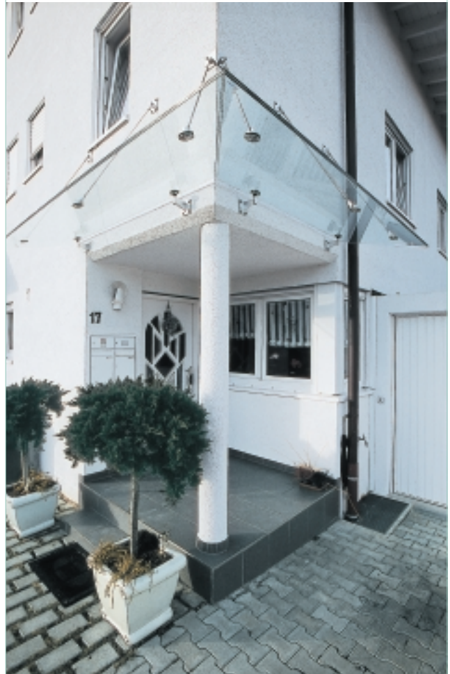
SANCO ROOF: Der perfekte Wetterschutz.

Der Eingang ist die Visitenkarte Ihres Hauses. Mit einem maßgeschneiderten Vordachsystem aus Glas lässt sich dieser Bereich ganz ohne massiven Eingriff in die Fassade aufwerten. Das Zusammenspiel von transparenten Glaselementen und filigranen Edelstahlhaltern macht SANCO ROOF zu einem idealen Wetterschutz, ohne Eingänge oder Terrassen zu verdunkeln. SANCO ROOF wirkt leicht, diskret und zeitlos. Es überzeugt durch seine vielfältigen Gestaltungsmöglichkeiten und seine pflegeleichte Langlebigkeit. Die Kombination von Glas und hochwertigen Beschlägen macht das Vordachsystem nicht nur ausgesprochen harmonisch, SANCO ROOF fügt sich auch in jedes architektonische Konzept, in jeden Baustil perfekt ein. Bei Neubauten ebenso wie bei der Modernisierung älterer Bauobjekte. Ein schönes architektonisches Detail, das Sie nie im Regen stehen lässt.