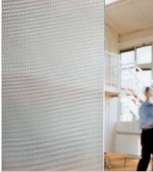
Türen mit wellenförmigem Rand. Anastasia Design.