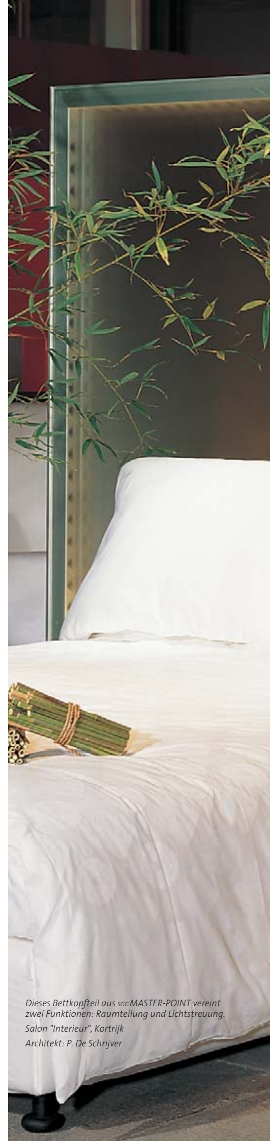
Dieses Bettkopfteil aus SGG MASTER-POINT vereint zwei Funktionen: Raumteilung und Lichtstreuung. Salon "Interieur", Kortrijk Architekt: P. De Schrijver

und der Verlegung der Gläser die Verlaufsrichtung beachten. Weiterhin empfehlen wir beim Zuschnitt von Gläsern, die nebeneinander verlegt werden sollen, auf den Musterversatz zu achten.